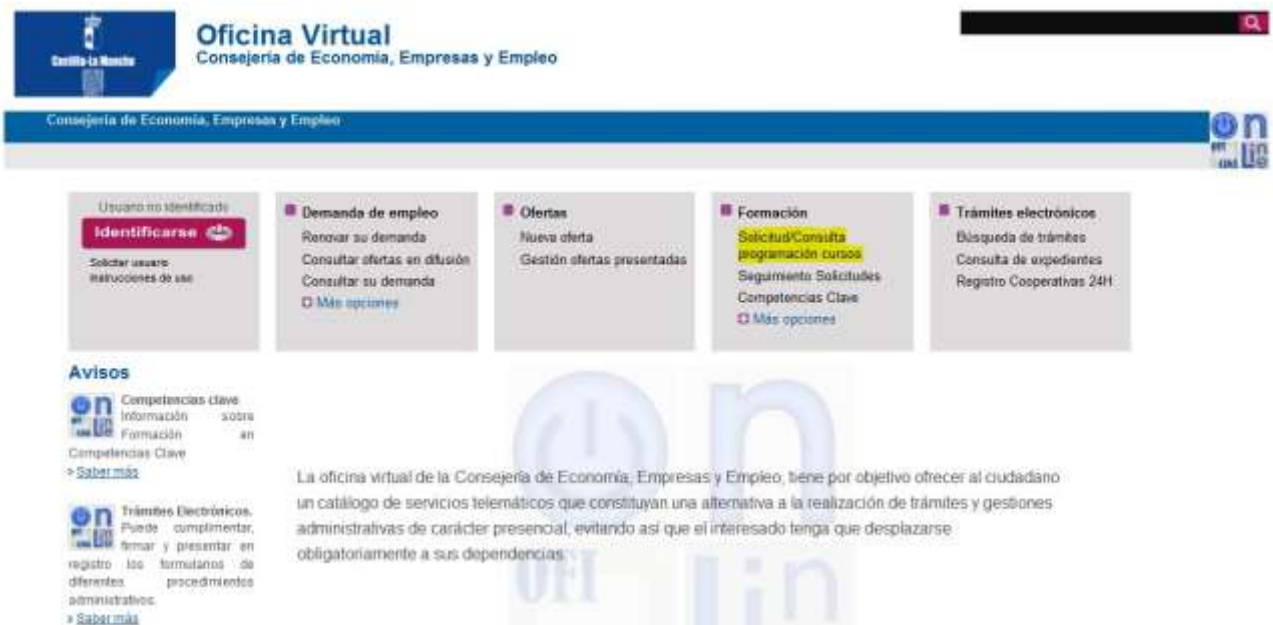
Figura 1: Búsqueda de cursos

Aparecerá la siguiente pantalla. Hay que pulsar en Formación: Solicitud/Consulta programación cursos, como se muestra en la Figura 1: