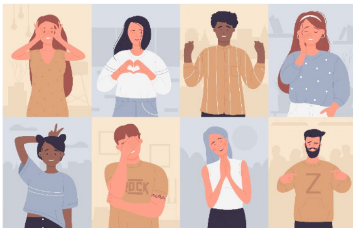
Lenguaje no verbal

Hemos de recordar y hacer hincapié en la importancia del lenguaje no verbal .